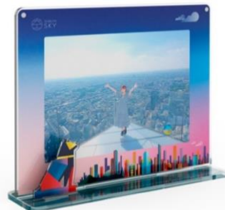
▲SHIBUYA SKY オリジナルフォトフレーム