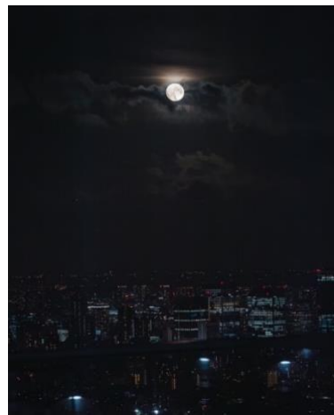
▲過去 SHIBUYA SKY より観測した満月