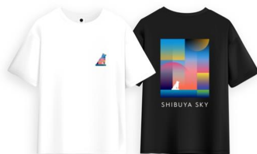
▲SHIBUYA SKY オリジナルTシャツ