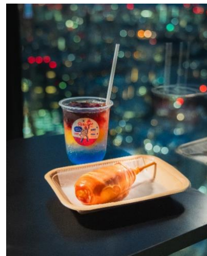
▲SKY AURORA DOG、SUNSET SKY