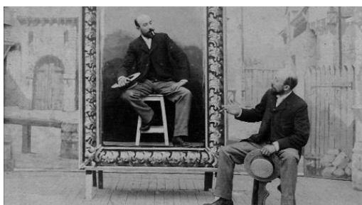
▲『メリエスの素晴らしき映画魔術』

作品情報：2024年の渋谷の上空で思い描く月への冒険。ライブ演奏付きで映画史上に輝く名作『月世界旅行』を上映。巨大な砲弾に乗って6人の天文博士たちが月面へと飛び立つ。そこは誰もみたことのない奇想天外な世界だった…。人類が月に到達するずっと以前、想像でしかなかった月面旅行を描いた『月世界旅行』は世界初の SF 映画。当時の映画についての考えを変えた画期的作品として映画史に燦然と輝く。