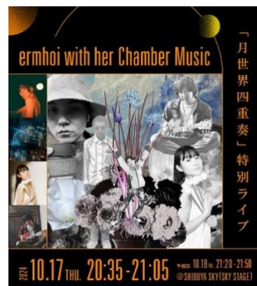
▲「月世界四重奏」特別ライブキービジュアル