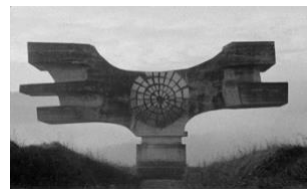
▲『最後にして最初の人類』

作品名：『最後にして最初の人類』デジタル／71分／2020（アイスランド） 監督：ヨハン・ヨハンソン 作品情報：2018年に早世したヨハン・ヨハンソンによる最初で最後の長編映画。時間と空間を超越したかのような斬新な映像世界が観客の想像力をかき立てる。