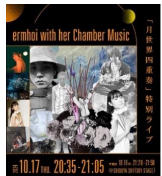
▲「月世界四重奏」特別ライブ キービジュアル

移りゆく多様な空の色に、映し見る心の色。グラデーションの中に、あなたの色を探す特別展示。