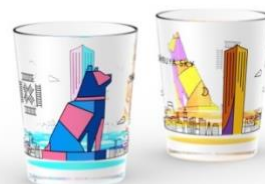
▲SHIBUYA SKY オリジナルショットグラス