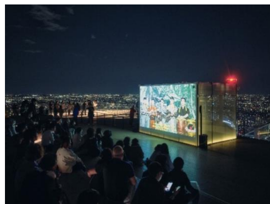
▲これまでの本イベントの様子

360度のオープンエアの屋上展望空間の中、大音量で自由に楽しむ4夜の特別上映イベントです。イメージフォーラムとSHIBUYA SKYのコラボレーションにより、ここでしか味わえない開放的な映画の楽しみ方の提供に加え、世界中から渋谷を訪れる来場者とともに、渋谷上空229mから空を見上げながら、空から続く宇宙に想いを馳せる映画をお届けします。