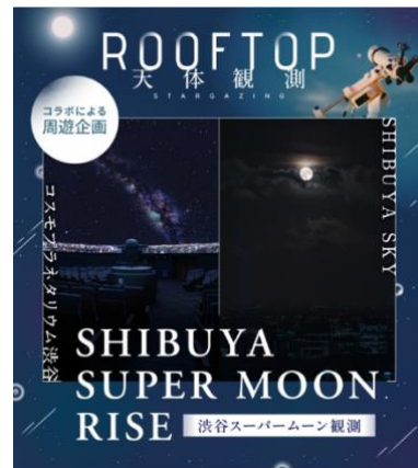
▲「渋谷スーパームーン観測」キービジュアル

10 月 17 日(木)19 時 30 分より、THEATER イベントとして世界最古の SF とも謳われる「月世界旅行」のフィルムの修復過程を記録したドキュメンタリー映画『メリエスの素晴らしき映画魔術』を上映します。上映後、20 時 35 分よりサイレント映画『月世界旅行』に合わせ、一夜限りのお月見ライブを開催いたします。ハープやシンセサイザー、チェロ、ヴィオラなどとの 4 重奏でお届けします。スーパームーンのもと、一夜限りの幻想的な空間をお見逃しなく。