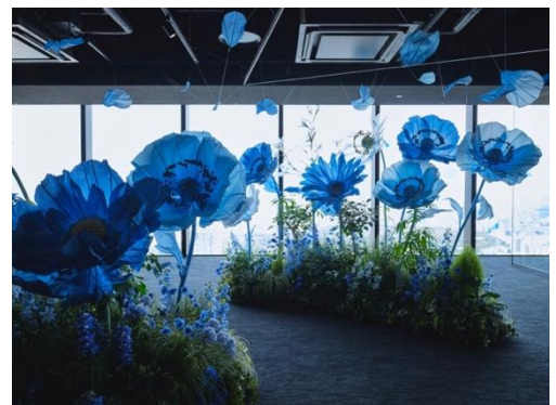
▲「Flowing Flowers」展示イメージ 昨年の様子

渋谷に根を張るレコードショップを舞台に展開してきた「ROOFMIX」が「MUSIC BAR SELECTION」へとリニューアル。