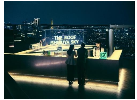
▲「THE ROOF SHIBUYA SKY」バーカウンター

特設サイト： https://www.shibuya-scramble-square.com/sky/the-roof/