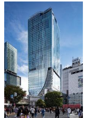
▲渋谷スクランブルスクエア外観

<本件に関する報道関係者さまからのお問合せ先> 渋谷スクランブルスクエア PR 事務局（株式会社サニーサイドアップ内） 担当： 國井（080-9175-6108）、葛山（080-4417-9759） E-mail：scramble_square_pr@ssu.co.jp