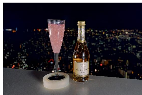
▲FLOWER CLOUD SPARKLE (フラワークラウドスパークル)

スナックはトリュフポテトスナックなど、夜景やお酒に合うスナックを揃えております。渋谷スクランブルスクエアの地下一階にも店舗を構える紀ノ国屋のスナックをお楽しみいただける「KINOKUNIYA SELECTION」も昨年に続きご用意しました。ぜひこの機会にお楽しみください。