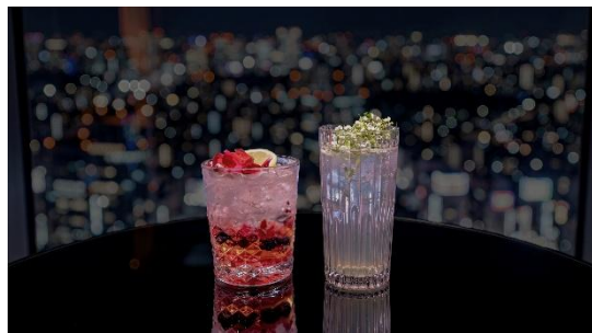
▲(左) ベルローズ スパークル (右) ロク ブロッサム フィズ

日本のクラフトジン「六」に、エルダーフラワーの優しい甘みを重ねたフローラルソーダ。繊細で爽やかな香りと透明感のある味わいに、ふわっとアリッサムを可憐なアクセントを添えて。 販売価格：1,300円(税込)