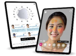
Skincare Pro | スキンケアプロ

iPad などの iOS 端末で利用できる画像解析型の業務用肌解析ソリューション。 高精度で可視化された肌診断結果を提供することで、 より納得感のあるアドバイスが可能となる。