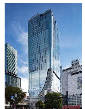
▲渋谷スクランブルスクエア(東棟)

名 称：渋谷スクランブルスクエア / SHIBUYA SCRAMBLE SQUARE 事業主体：東急(株)、東日本旅客鉄道(株)、東京地下鉄(株) 所 在：東京都渋谷区渋谷2丁目24番12号 用 途：事務所、店舗、展望施設、駐車場など 延床面積：第Ⅰ期(東棟)約181,000㎡、第Ⅱ期(中央棟・西棟)約95,000㎡ 階 数：第Ⅰ期(東棟)地上47階地下7階、第Ⅱ期(中央棟)地上10階地下2階、 (西棟)地上13階地下4階 高 さ：第Ⅰ期(東棟)229.7m、第Ⅱ期(中央棟)約61m、(西棟)約76m 設 計 者：渋谷駅周辺整備計画共同企業体 ※(株)日建設計、(株)東急設計コンサルタント、(株)JR東日本建築設計、メトロ開発(株) デザイン・キタ：(株)日建設計、(株)隈研吾建築都市設計事務所、(有)SANAA 事務所 運 営 会 社：渋谷スクランブルスクエア(株) ※東急(株)、東日本旅客鉄道(株)、東京地下鉄(株)の3社共同出資 開業/完成：第Ⅰ期(東棟)2019年11月1日開業 第Ⅱ期(中央棟・西棟)2031年度完成(予定) U R L： https://www.shibuya-scramble-square.com